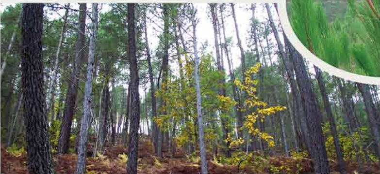
Forêt de pins de Salzman et de pins maritimes

Le pin de Salzman a des aiguilles groupées par deux, de 10 à 18cm de long droites souples et non piquantes, regroupées elles forment un pinceau. Son cône de 5 à 8 cm de long est porté par un court pédoncule. Le rameau de l'année est orangé, dépourvu d'aiguilles à la base. Le tronc est souvent sinueux avec un étagement des branches non régulier.